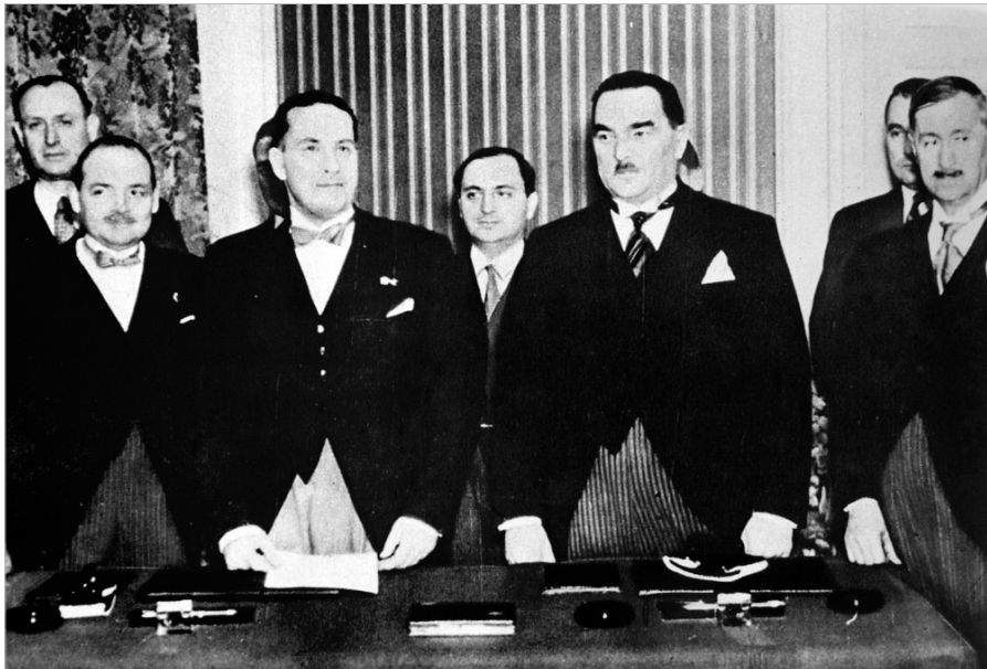
Гроф Бано и председник владе Милан Стојадиновић након потписивања Пакта Југославија – Италија, 25. март 1937. године