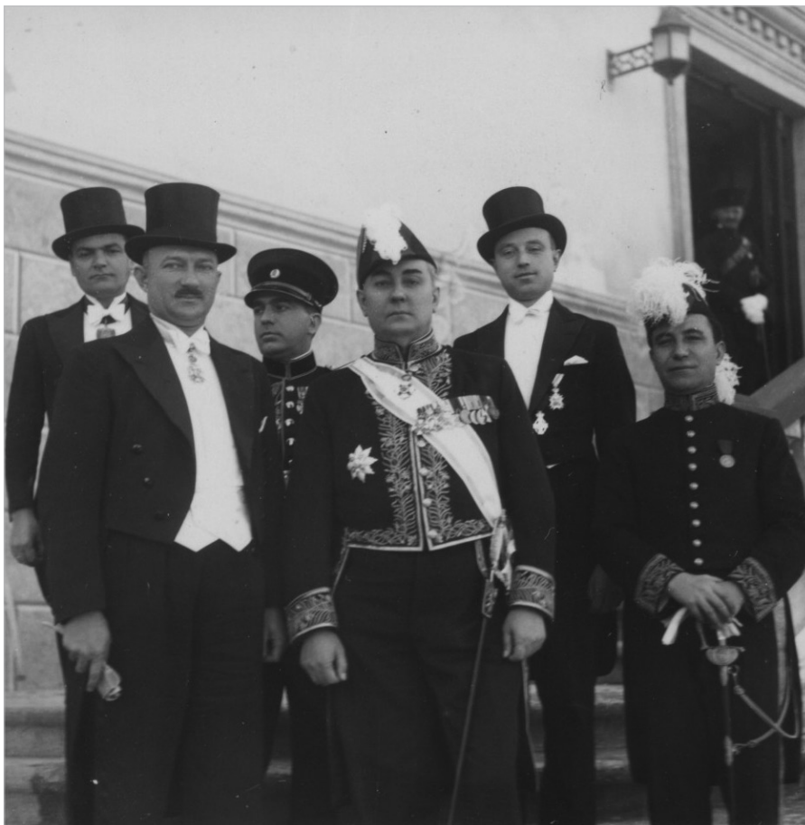
Предаја акредитива изванредног посланика и опуномоћеног министра Радоја Јанковића краљу Албаније Ахмету Зогу, 6. јануара 1937. године. У првом реду (слева надесно) г. Милоје Смиљанић, саветник, г. Радоје Јанковић, посланик, и Сотир Мартини, церемонијал мајстор Двора. У другом реду г. Димитрије Тошковић, секретар посланства, г. Љубомир Петровић, војни изасланик и г. Јосип Логар, писар посланства.