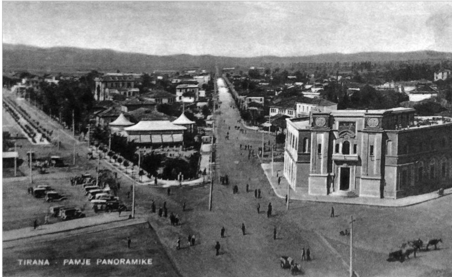
Тирана је 1937. године имала два булевар, електрику и пар асфалтираних улица, али је била без воде и канализације