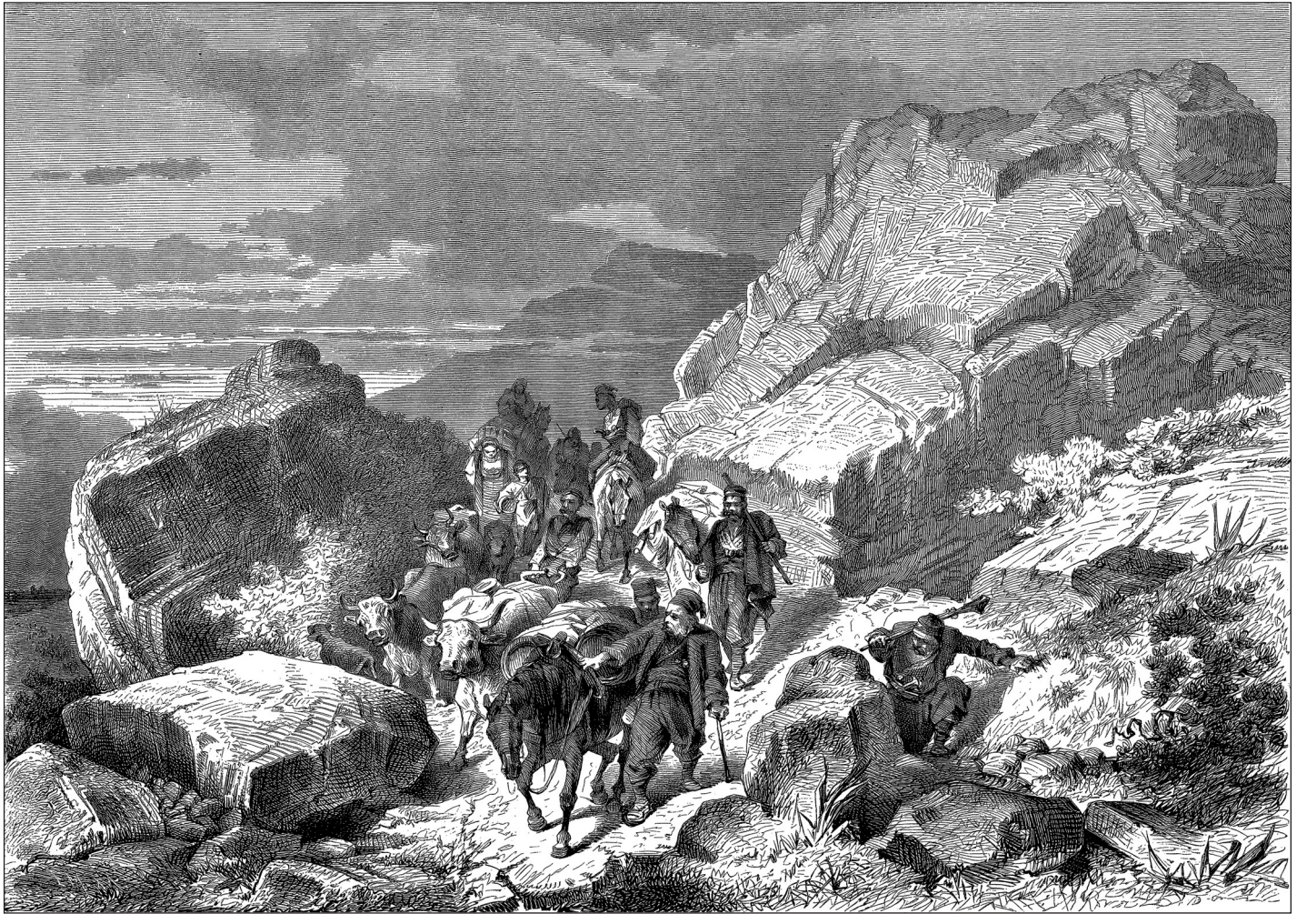
Еуген Адам: „Слике из Херцеговине – Херцеговачки сељаци у збегу”, Убер ланд унд мер, 4, 1875.

Илустровани часопис Убер ланд унд мер из Штутгарта живо је пратио догађаје на Балкану. У овом листу налазимо знатан број изванредних илустрација и обимних текстова.