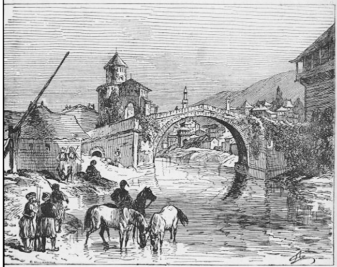
„Mostar – главни град Херцеговине”, Илустриртес винер Екстраблат, 10. септембар 1875.