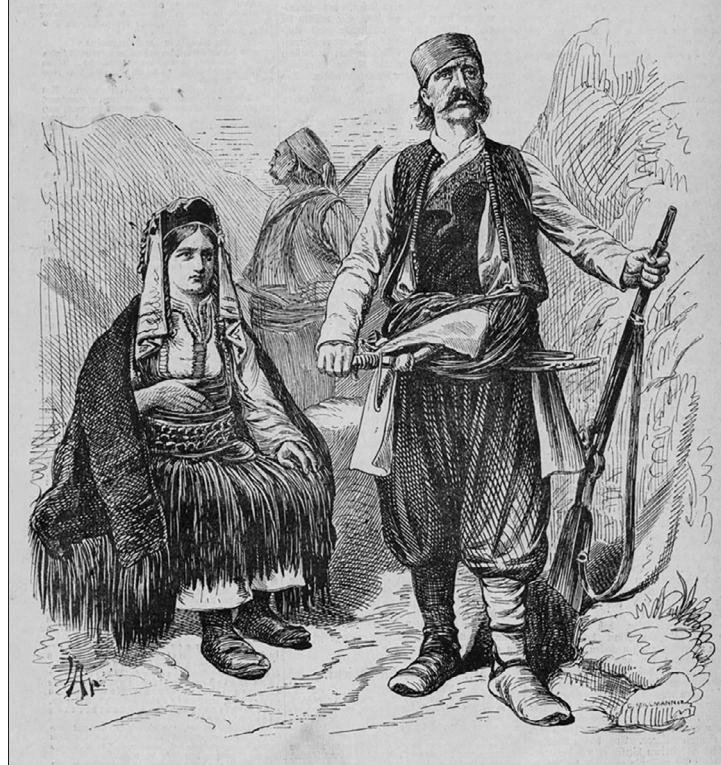
„Раја из Херцеговине”, Илустриртес винер Екстраблат, 17. септембар 1875.