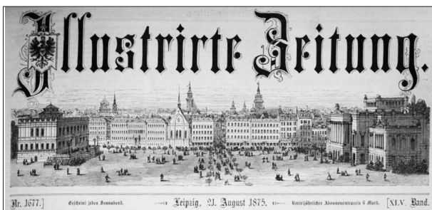
Илустровани часопис Илустрирте цајтунг из Лајпцига