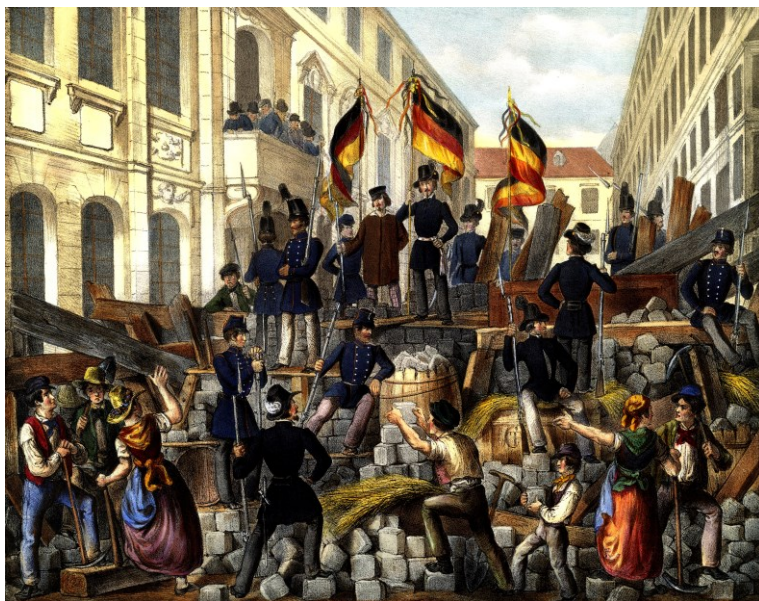
Барикаде у Бечу, маја 1848.

индивидуалним слободама, правној и имовинској равноправности и уопште, истицана су сва „природна права“ човека. На свим језицима су извикиване пароле „Живела слобода“, „Слобода и братство“... У овим покретима, насупротив владарским династијама, племству и војсци, у првим редовима је стајала грађанска класа, поникла из народа. Њени представници су били буржоазија и интелигенција, којима се придружио и део либералног племства. У земљама са израженим феудалним системом, а то су биле скоро све осим Француске, значајну масу у редовима револуционара представљало је и сељаштво. Оно је истакло свој захтев за решавањем аграрног питања. У већини држава, грађанска класа је била и носилац националне свести, те су са економским и политичким захтевима ишли и они национални. Ово је нарочито било изражено код народа који још нису имали своју јединствену државу. 2