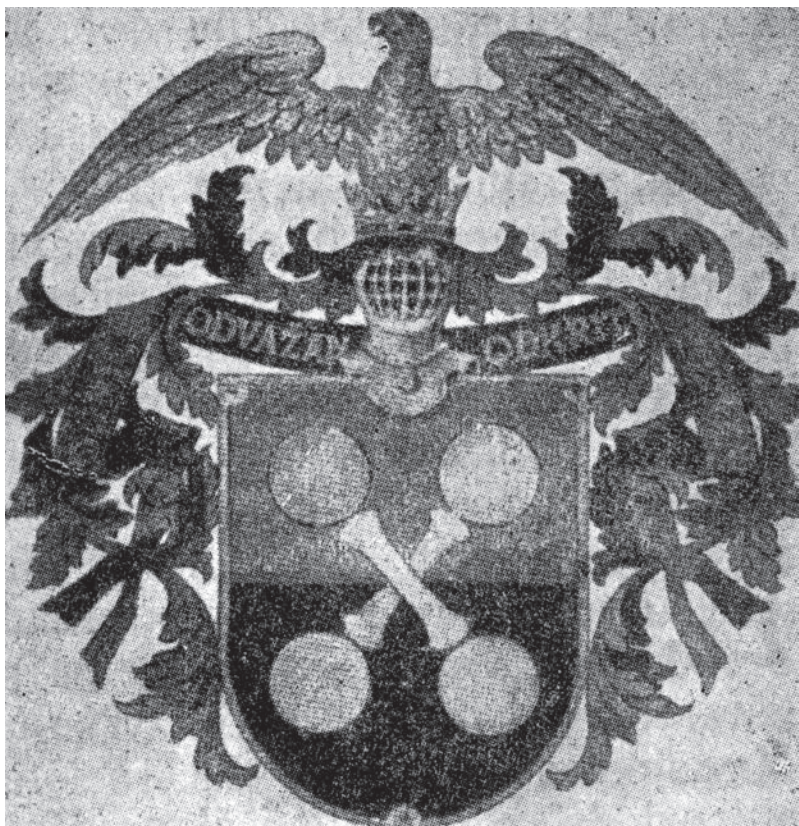
Теловеждайшељски ірб словенски

це Пољског гимнастичког друштва 1892. године одржан слет и том приликом се формирао Савез пољских соколских гимнастичких друштава у Аустрији, Малопољској. Следеће године оснива се Савез великопољских сокола, у тадашњој Прусској, да би у Пољском краљевству, тада делу Пољске који се налазио у саставу Русије, Соколски покрет био основан 1905. године. Политичке идеје Пољског соко-