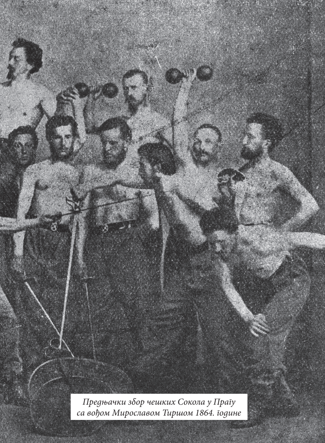
Предњачки збор чешких Сокола у Прагу са вођом Мирославом Тиршом 1864. године