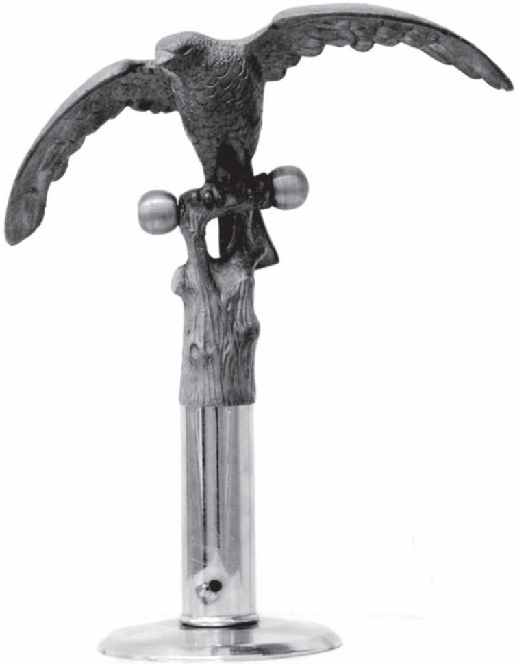
Са сїеїа соколске засїїаве карловачкої сокола