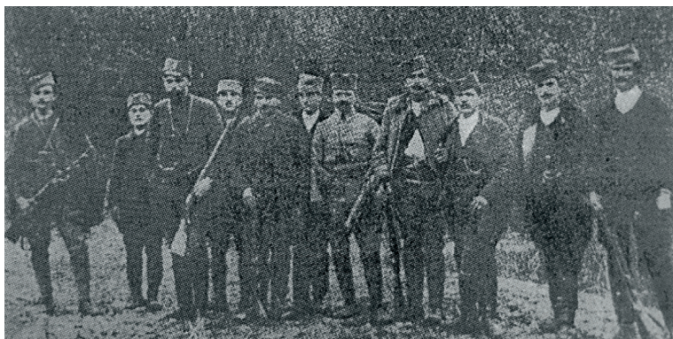
Коста Пећанац са групом четника

било правих ратника. Они прави, који су преживели Турски и Бугарски рат, крваве борбе на Церу, Гучеву и другим поприштима, који су преживели голготе Албаније, тифус и друге многобројне недаће, налазили су се негде на Солунском фронту вребајући тренутак за одмазду. Мучки напад и нож у леђа од стране Бугара, није смео остати некажњен.