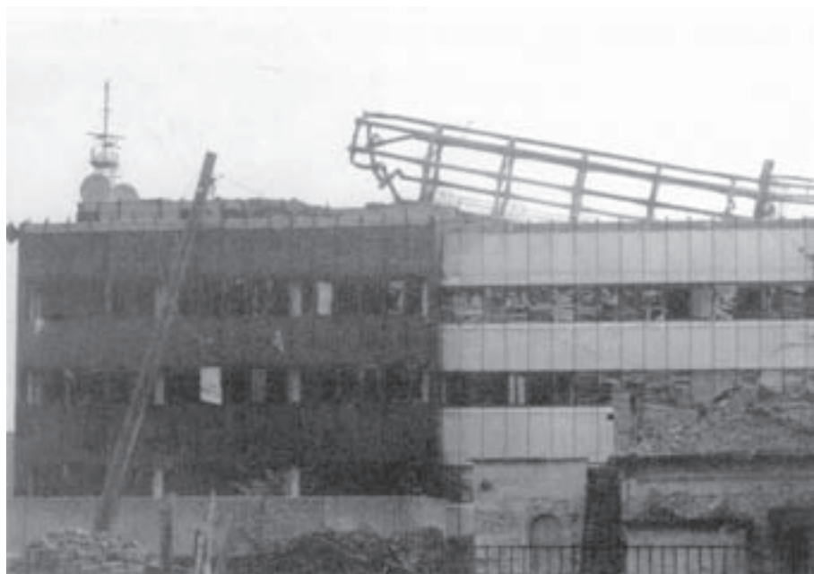
Разрушена зграда новосадске телевизије

Зграда из које се емитовао програм на српском и језицима националних мањина у Војводини бомбардована је пет пута.