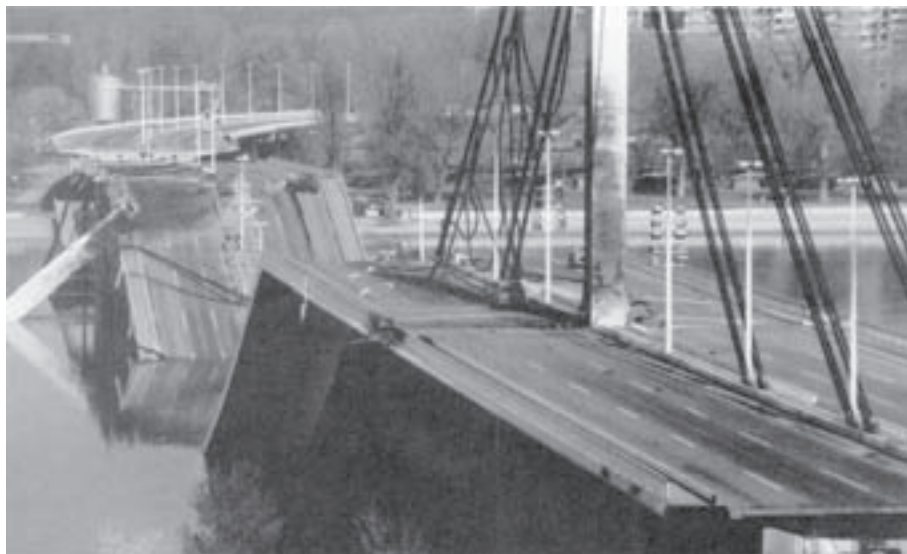
Несћао у шрену – Мост слободе

Ракета је погодила пилон – челични стуб о кога су била окачена ужад која су држала мост. Погодак је био тачно у подножје пилона с новосадске стране. Удар је био тако јак да је пилон просто одсечен, иако је на том месту био широк 3,6 метара. А кад је сандучасти стуб пао у Дунав, пала су и сва ужад која носе главни отвор моста.