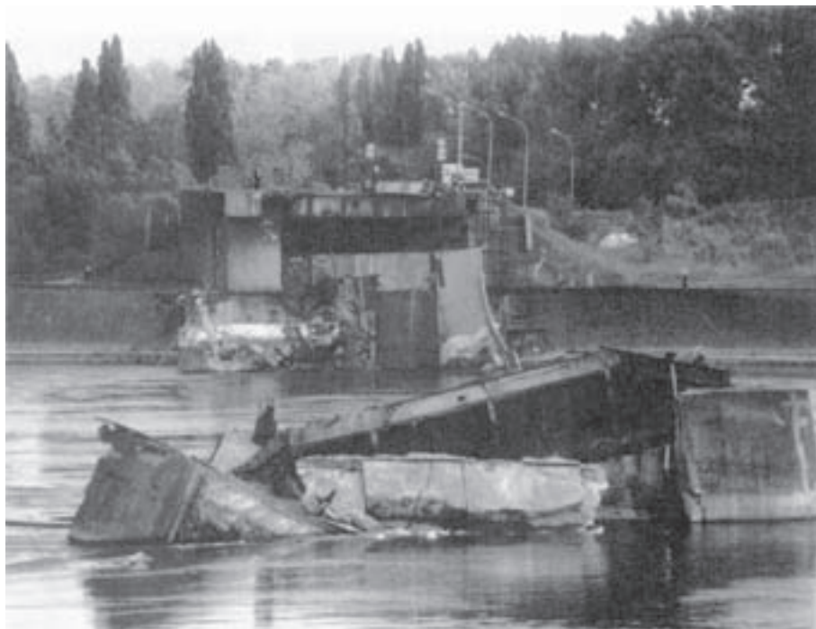
Херој и мученик: Жежељев мост после коначног рушења

Грађен је од преднапрегнутог бетона. Дело чувеног неимара наше мостоградње академика Милана Жежеља.