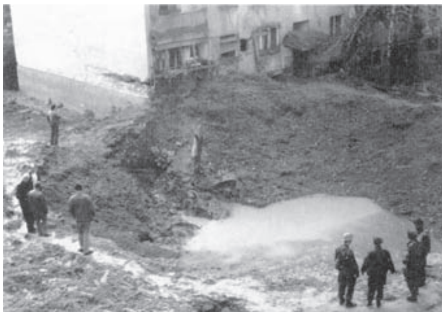
Срећом, сви су живи – Детелинара, после ђурђевданског бомбардовања

На Ђурђевдан, 6. маја у 14.30 на тај део Новог Сада пала су четири пројектила. У кварту омеђеном улицама Јанка Чмелика и Ђуле Молнара налазио се кратер дубок око двадесет а широк десетак метара. Две зграде више нису биле за становање, без крова над главом остало је 80 породица, најмање 40 грађана је лакше повређено, изваљени прозори и врата, а уништено је више од 30 аутомобила.