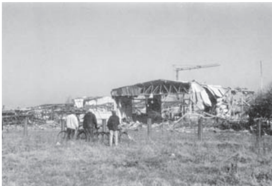
Унишћени објекти на Клиси

Страдали су погони, хале, магацини „Техногаса”, „Новограпа”, „Албуса” и других фабрика. На многим кућама на Клиси попуцала су прозорска стакла. У први мах, грађани нису поверовали да је наша земља нападнута.