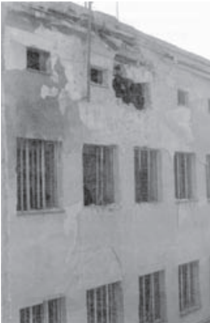
Нису је рушили ни претходни ајресори: Извршно веће оштећено пројекцијом НАТО-а