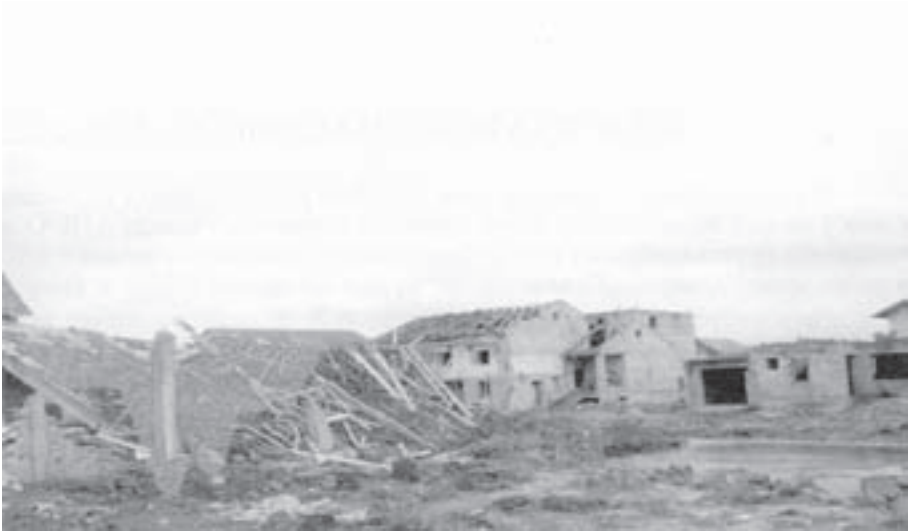
Од кућа – кри: Видовданско насеље