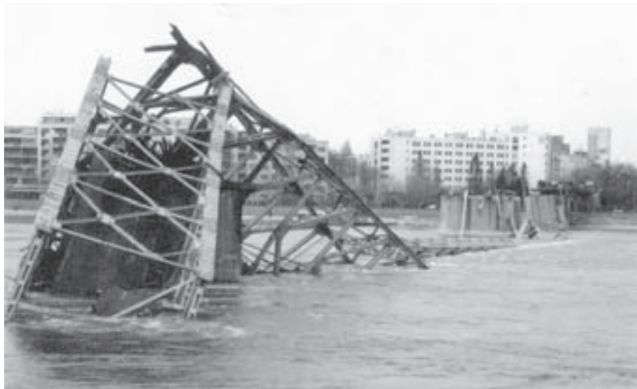
За њим се највише туговало – срушени Варадински мост

Овај мост, грађен по принципу решетке, да би био срушен морао је бити погођен директно у спојеве решеткастих носача. Пројектил је навођен тачно на најосетљивије место челичног носача.